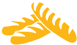
Panes / cereales